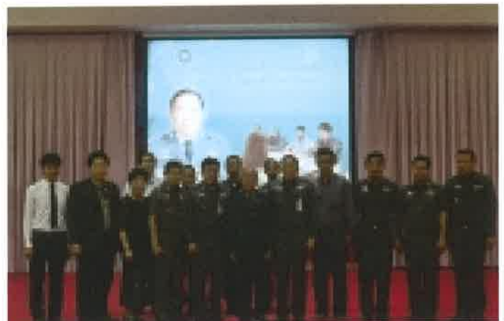
สถานีตำรวจนครบาลเมืองสงขลา ม.ทักษิณ จับมือพร้อมยกระดับการบริการประชาชน