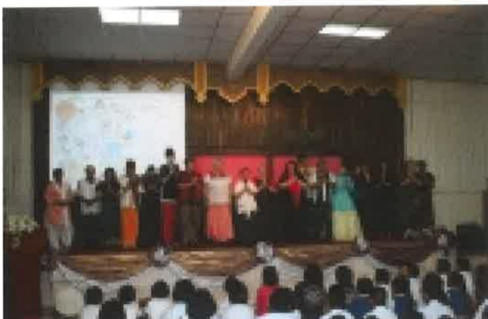
ม.ทักษิณจัดงานเทศกาลเสานานาชาติ ในประเทศไทย ครั้งที่ 5